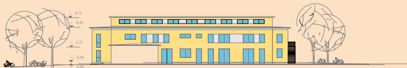
ANSICHT - WEST - Innenflächen