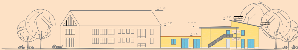
ANSICHT - SÜD - Innenflächen