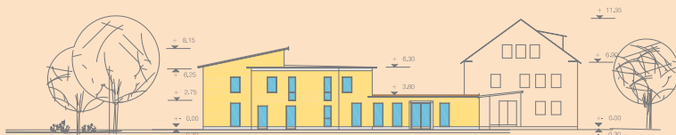
ANSICHT - NORD - Humperdinckstraße